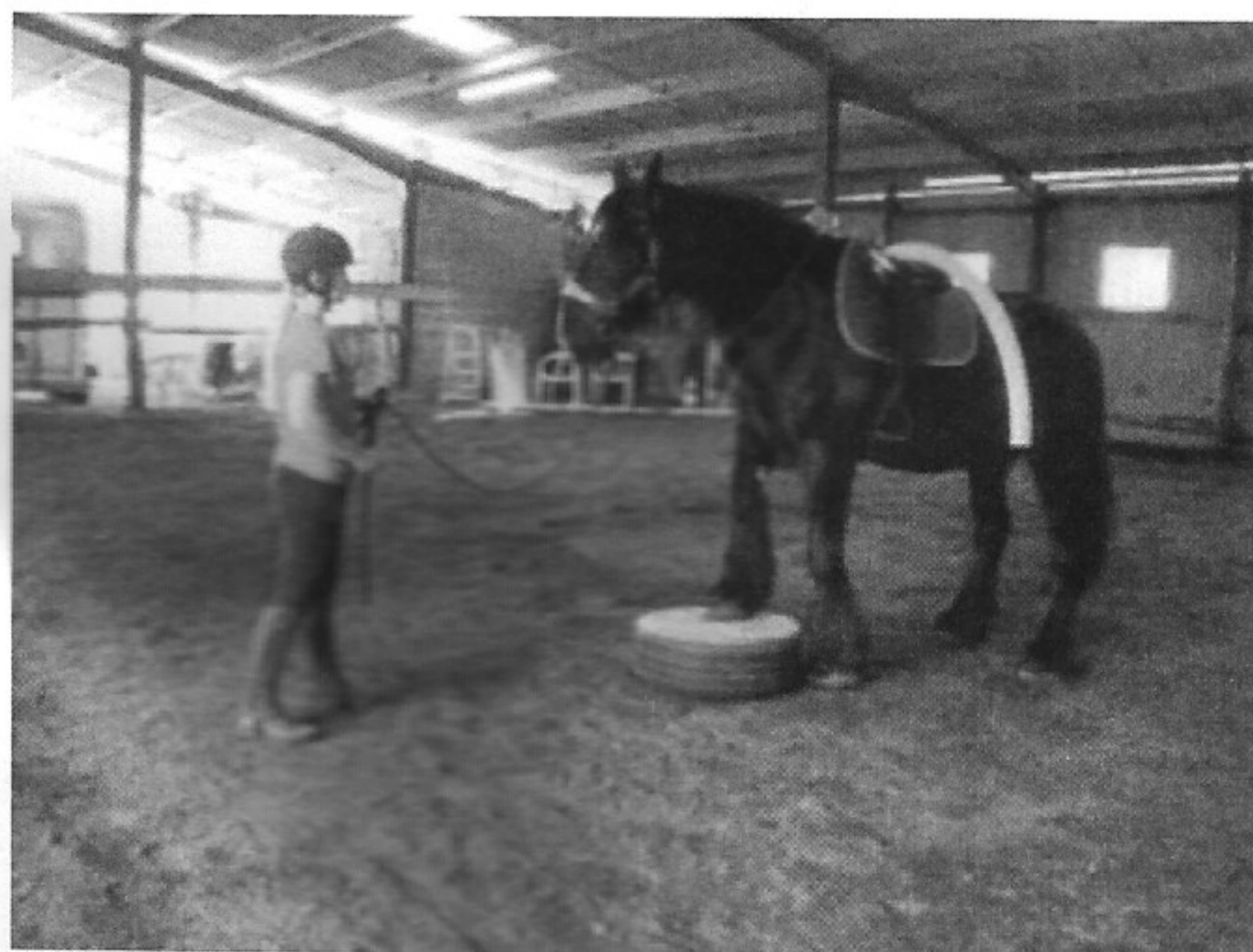
Calice du Magnou sur une séance de travail